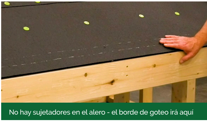
No hay sujetadores en el alero - el borde de goteo irá aquí