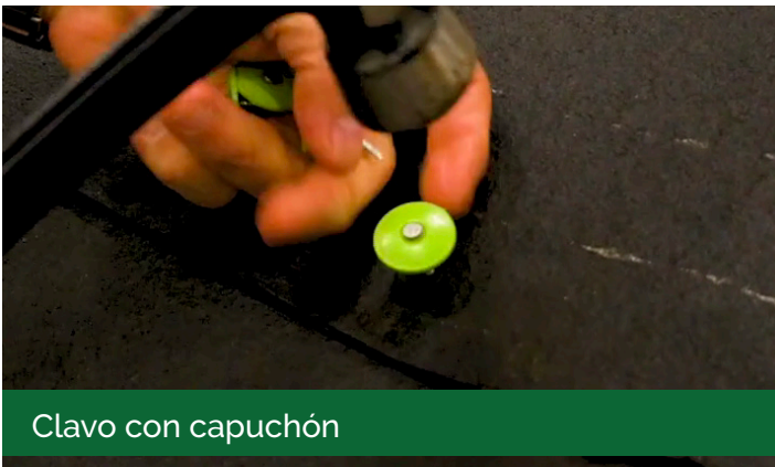
Clavo con capuchón