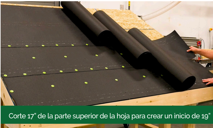
Corte 17" de la parte superior de la hoja para crear un inicio de 19"