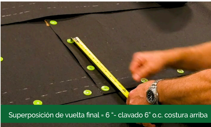
Superposición de vuelta final = 6" - clavado 6" o.c. costura arriba

Escriba el domicilio en el deck del techo